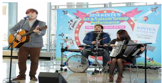
<킨텍스 문화 예술단 활동 장면 예시>