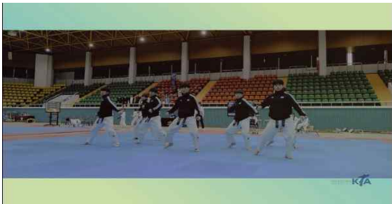
<태권체조 대회 장면 예시>