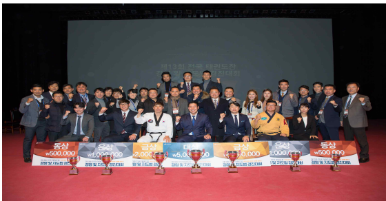
<경영 및 지도법 경진대회 장면 예시>