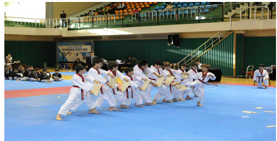
<시범경연 장면 예시>