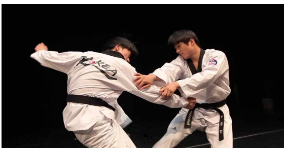
<KTA 국가대표 시범단 시범 공연>