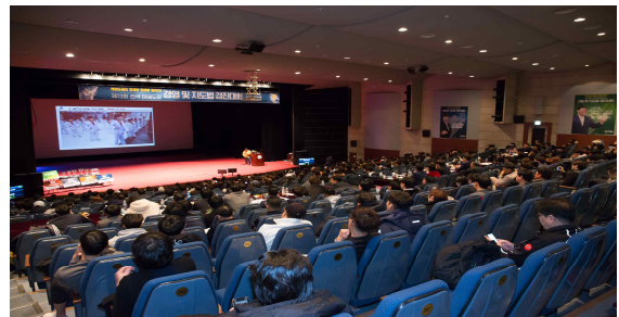
<경영 및 지도법 경진대회 장면 예시>